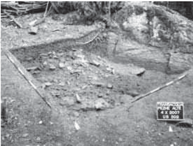
Il tetto dell'accumulo di scorie