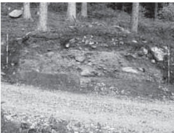
Struttura di combustione sulla sezione esposta in loc. Acquedotto del Faoro