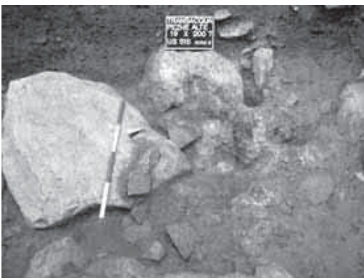
La probabile struttura fusoria